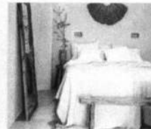
ALOJAMIENTO Jardín de Teresita