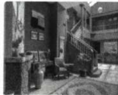
ALOJAMIENTO Selina Cuenca