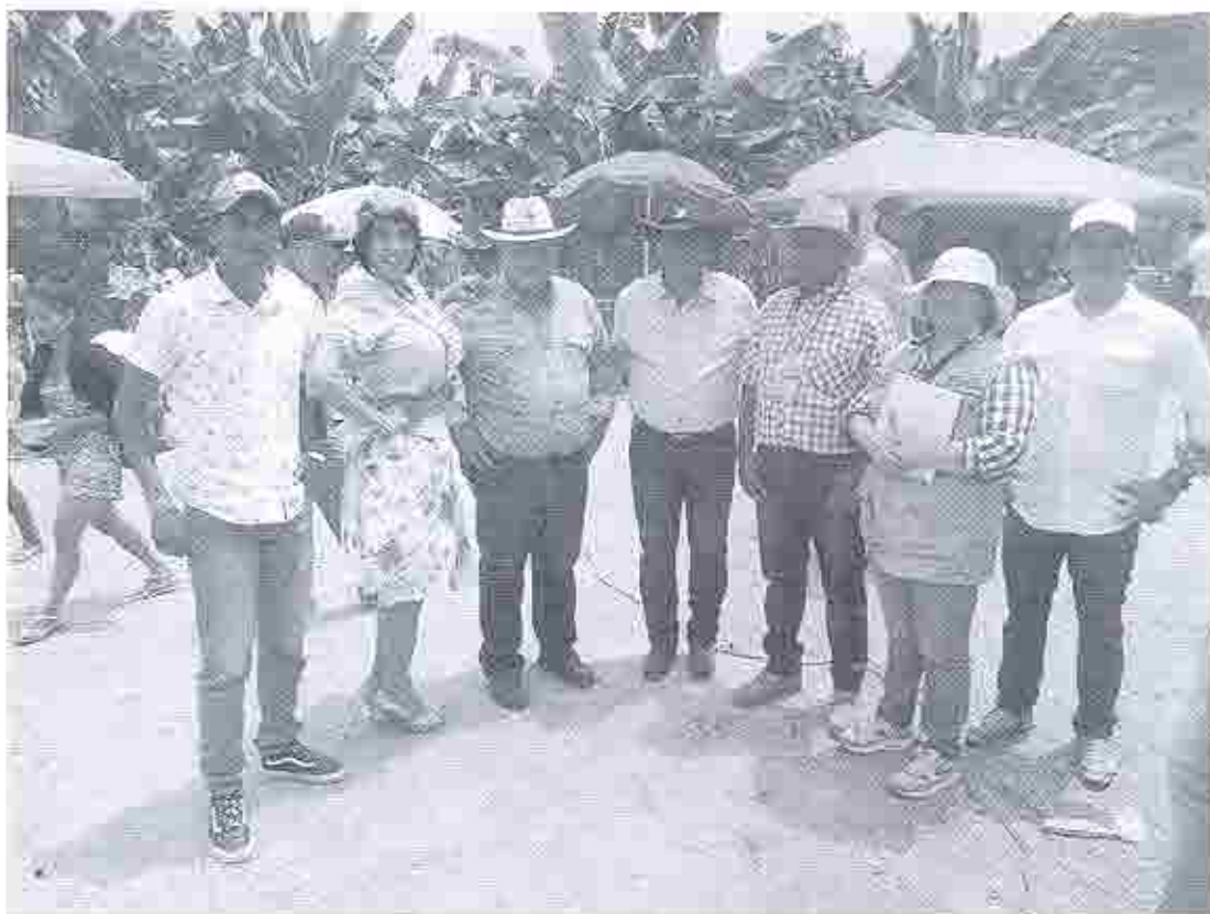
Grupo de ganaderos entre los que constan el Vice alcalde del GAD de Pedernales y el Presidente de la Junta Parroquial, con quienes se mantuvo entrevistas en el Festival del Queso, cuajada y suero blanco en Atahualpa el 10 de agosto de 2019.