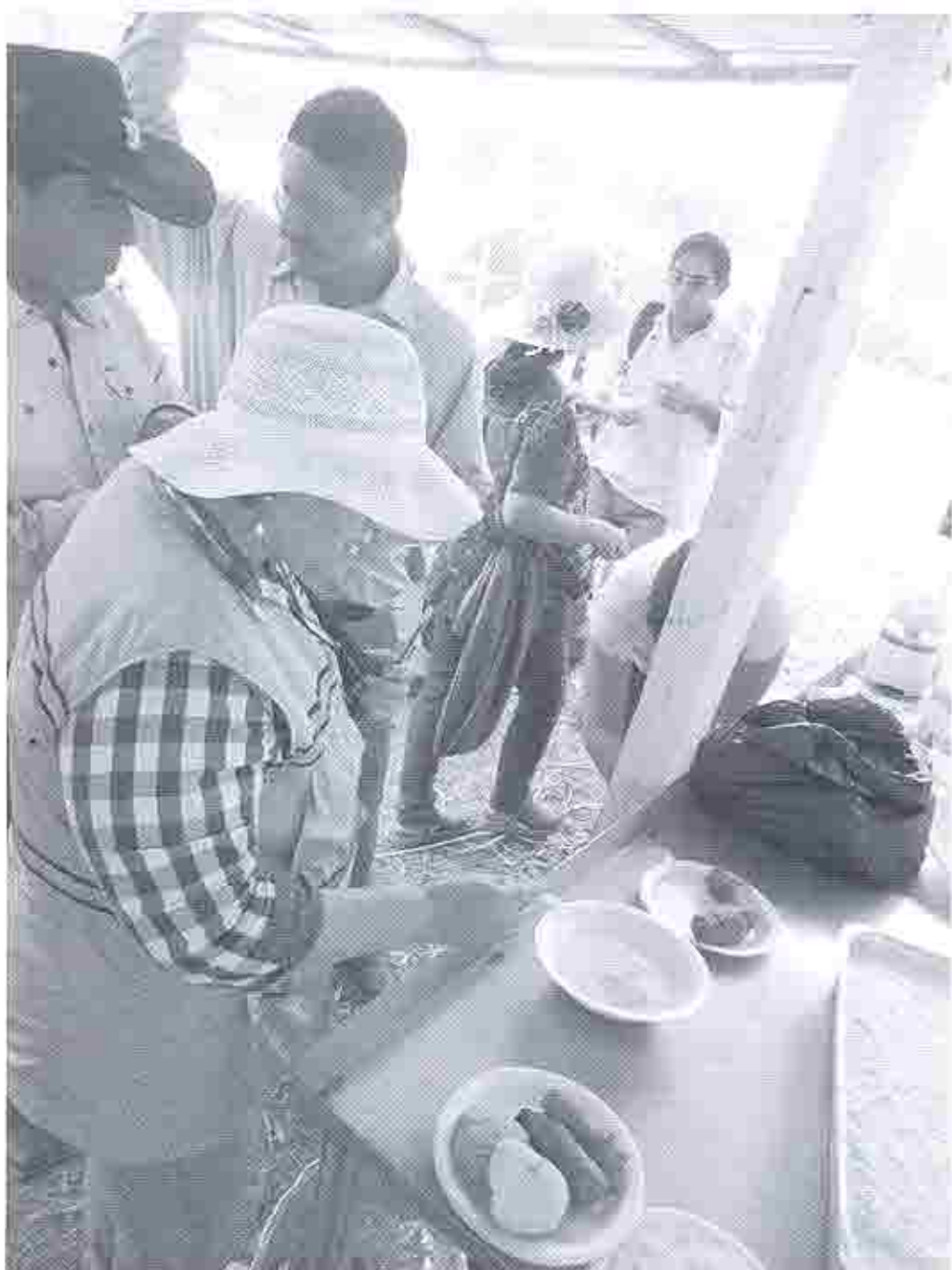
Degustación del Suero Blanco, con los bocadillos tradicionales de la cocina manabita con que se acompañan y realizan productos elaborados con el uso de la leche y sus derivados como el queso, con los que se realizan el pan de almidón y las tortillas de maíz.