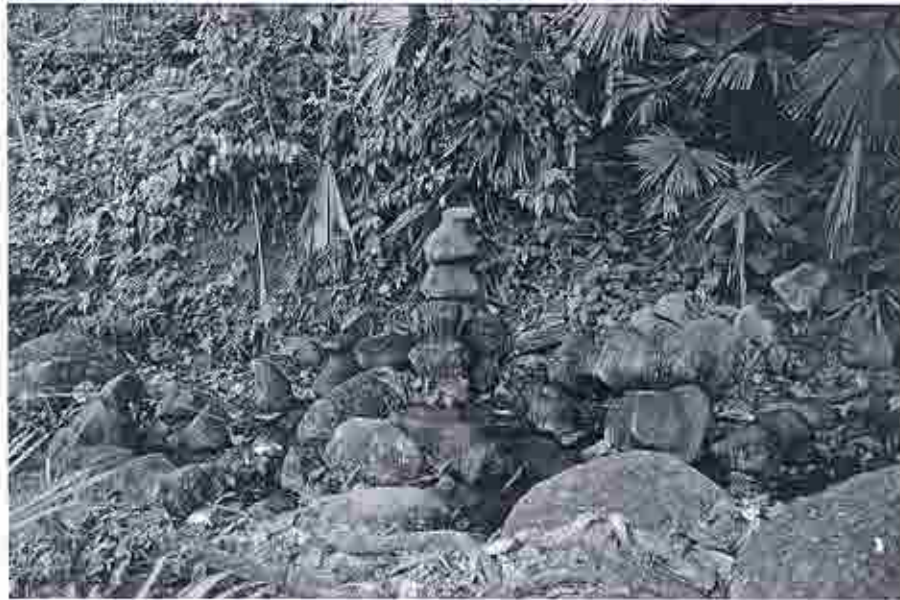
Fotos 20 a 22.- panorámica del grupo de monolitos en el Estero Moralito

monolitos, conforme se desmorona el talud del estero, con formas muy singulares, como se ve en las fotografías que incluyo.