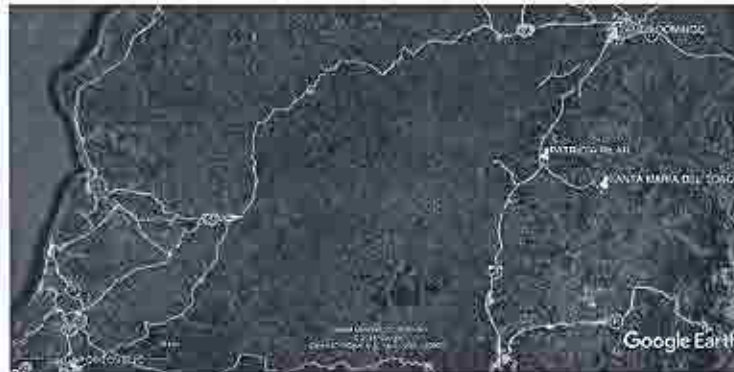
Mapa 1.- Ubicación de las poblaciones en la ruta de la visita técnica.