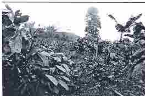
Foto 9.- ubicación de la casa de finca, con respecto al área de montículos y cultivos

Foto 10.- cima del Montículo C en el área