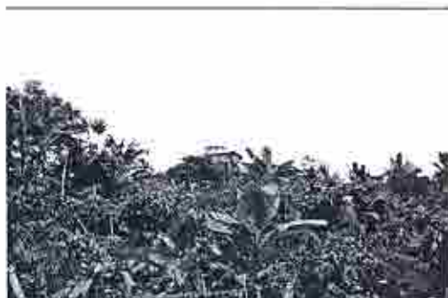
Foto 11.- panorámica del Rancho Buenaventura, sitio del hallazgo

Foto 9.- ubicación de la casa de finca, con respecto al área de montículos y cultivos