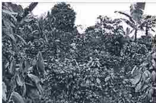
Foto 10.- cima del Montículo C en el área

Foto 8.- registro de la siguiente cima de otro montículo en el área, Montículo B (foto tomada desde la cima del montículo intervenido)