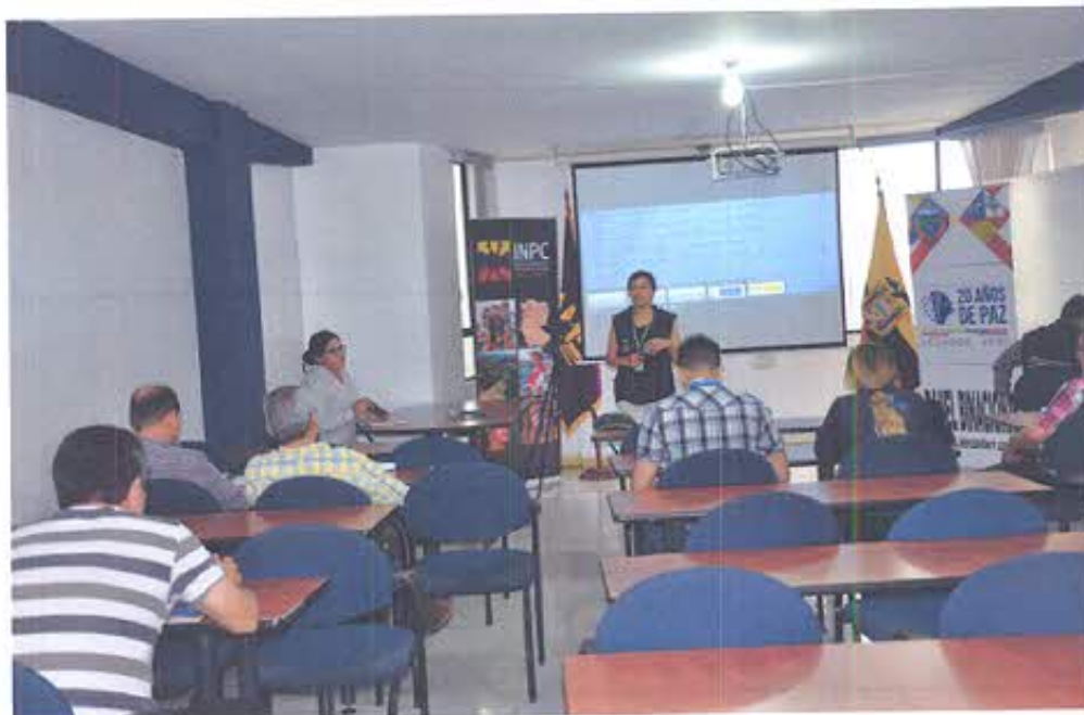
Taller desarrollado en el AME – Machala