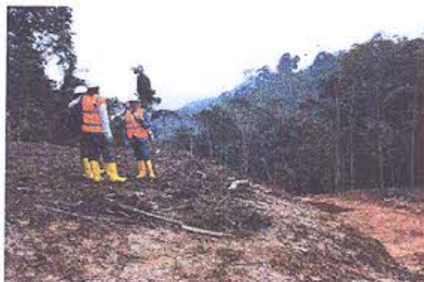
Foto 3.- Personal del INPC R7 en el área de monitoreo de la vía Pindal-Machinaza

Se inspeccionó también el área de monitoreo arqueológico en el replanteamiento de la vía Pindal Machinaza, coordenada E 769201 N9583597.