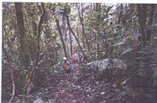
Foto 4.- Camino de acceso hacia el AIA 13, en el sector del Higuerrón.

Se realizó la inspección al rescate arqueológico del AIA 13 del replanteamiento (2018) de la vía Pindal (sector el Higuerrón) coordenada de referencia 771163 9584788 abscisa 13+585, donde se han excavado 20 unidades, estas contienen material cultural cerámico y lítico importante.