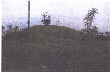
Foto 1.- Vista del área V10 de la línea de transmisión