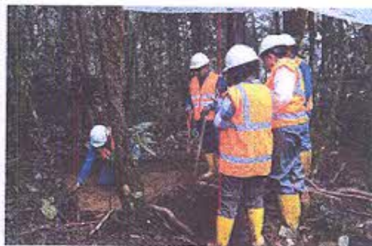
Foto 5.- Vista del área en donde se realizan las labores de excavación de rescate.