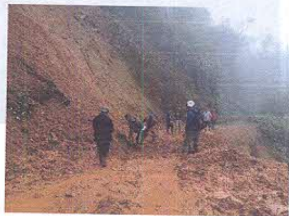
Foto 2.- Derrumbe localizado en la vía hacia El Plateado