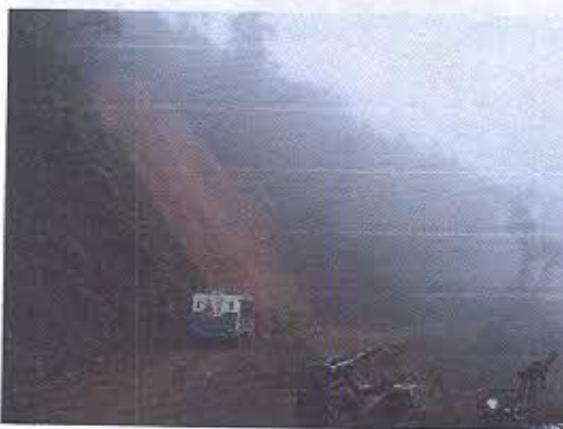
Foto 1.- Vista de la vía hacia el sector de El Planteado

En vista de lo cual se consultó con personas de lugar sobre la construcción de la vía, si durante los meses pasados se habrían ejecutados trabajos de remoción de suelo por los trabajos de construcción, ante lo cual todos afirmaron que por el mal tiempo y por qué este tramo de la vía se encuentra en estudios los trabajos se encuentran paralizados.