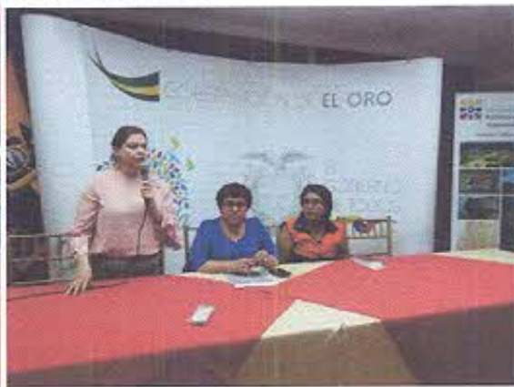
Entrega de los documentos físicos a la gobernadora