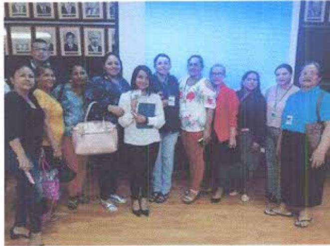
Equipo técnico del INPC Z7 junto a miembros de la comunidad Ancestral de San Gregorio