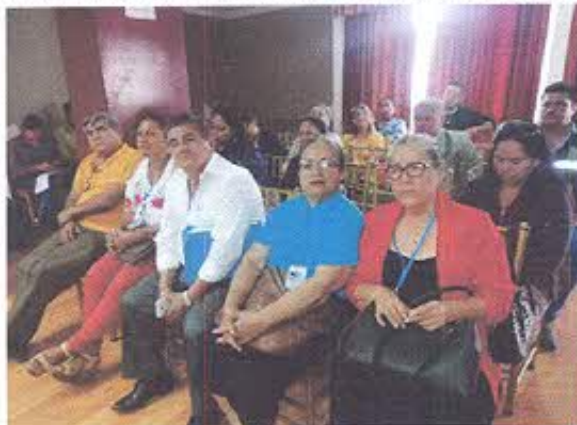
Público presente en el evento.

Finalmente se dio paso para preguntas y opiniones del público.