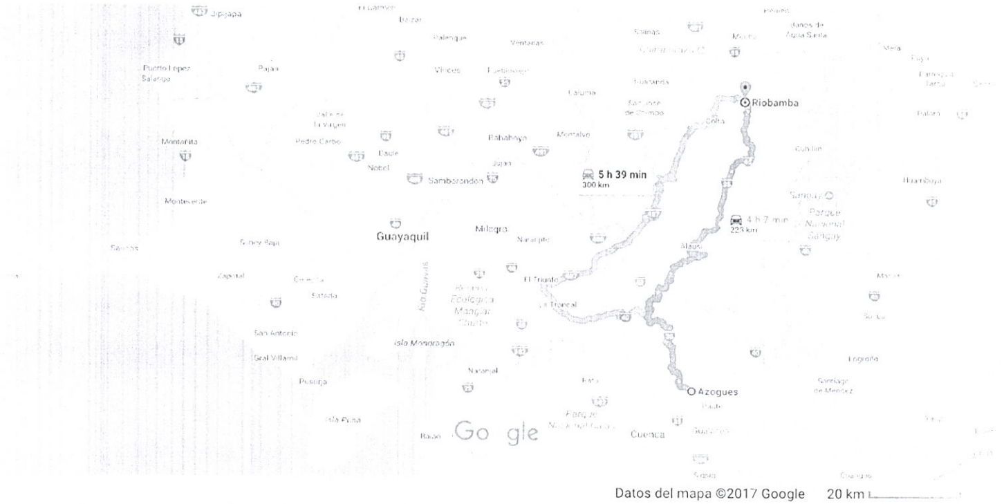
20 km