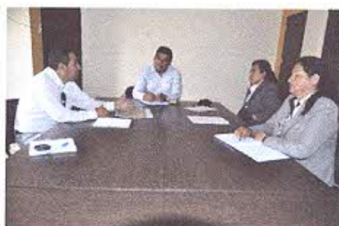
Figura 2.- Reunión de trabajo con los técnicos del GAD cantonal de Chilla.