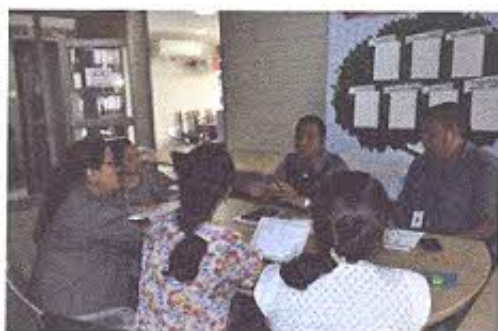
Figura 1.- Reunión de trabajo con los docentes de la Universidad Técnica de Machala.