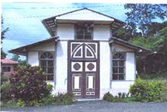
FOTOGRAFIA NRO. 5: Iglesia del Sector Los Faiques