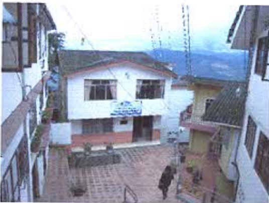
FOTOGRAFIA NRO. 3: Colegio Miguel Sanchez Astudillo