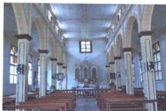
FOTOGRAFIA NRO. 6: Interior de Iglesia del Sector Los Faiques