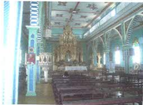
FOTOGRAFIA NRO. 2: Interior de la Iglesia de Zaruma