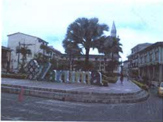
FOTOGRAFIA NRO. 1: Iglesia de Zaruma