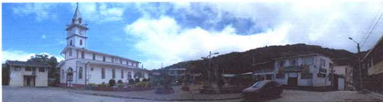
FOTOGRAFIA NRO. 7: Iglesia del Sector Malvas