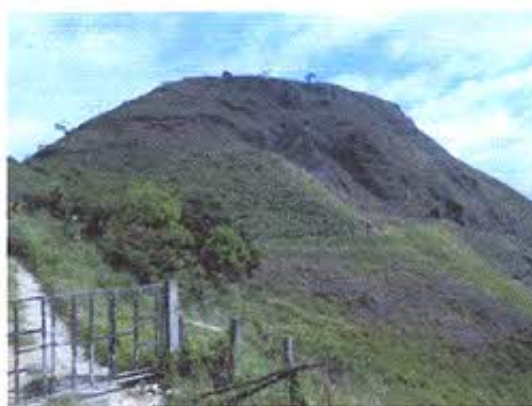
FOTOGRAFIA NRO. 9: Cerro Zaruma Urco