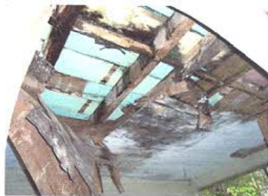
FOTOGRAFIA NRO. 4: Estado actual de bloque patrimonial emplazado al interior del predio del Colegio.