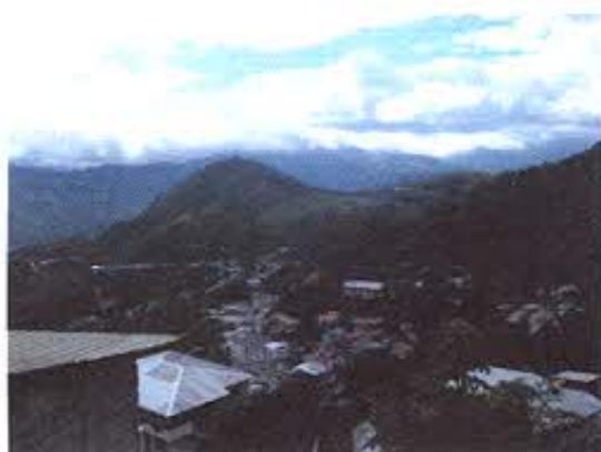
FOTOGRAFIA NRO. 8: Cerro Zaruma Urco