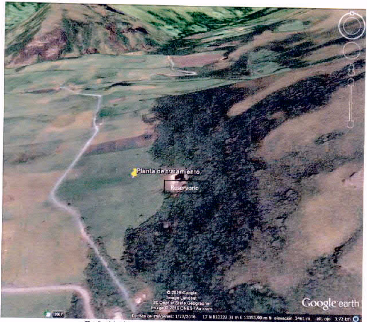
Fig. 3: sitio de implantación de la planta de tratamiento