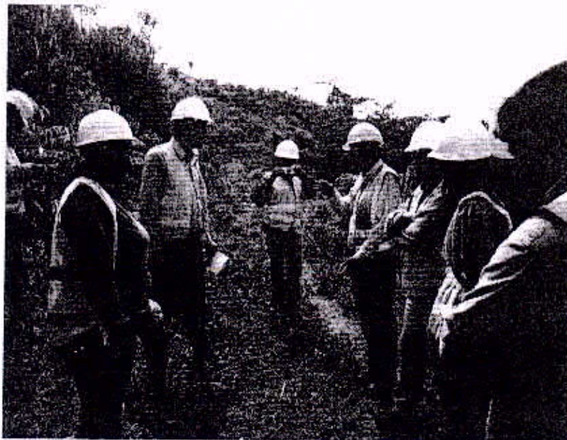
Foto N° 2: Técnicos del INPC-HIDROEQUINOCCIO-CONSTRUCTORA NACIONAL Camino a casa de máquinas (abscisa 0+800).