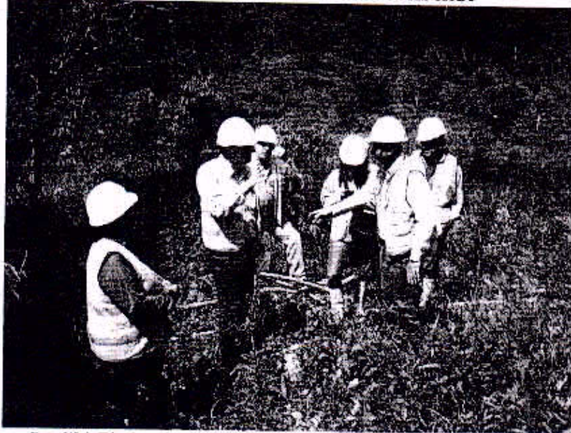
Foto N° 1: Técnicos del INPC-HIDROEQUINOCCIO-CONSTRUCTORA NACIONAL Sitio arqueológico Capillapamba