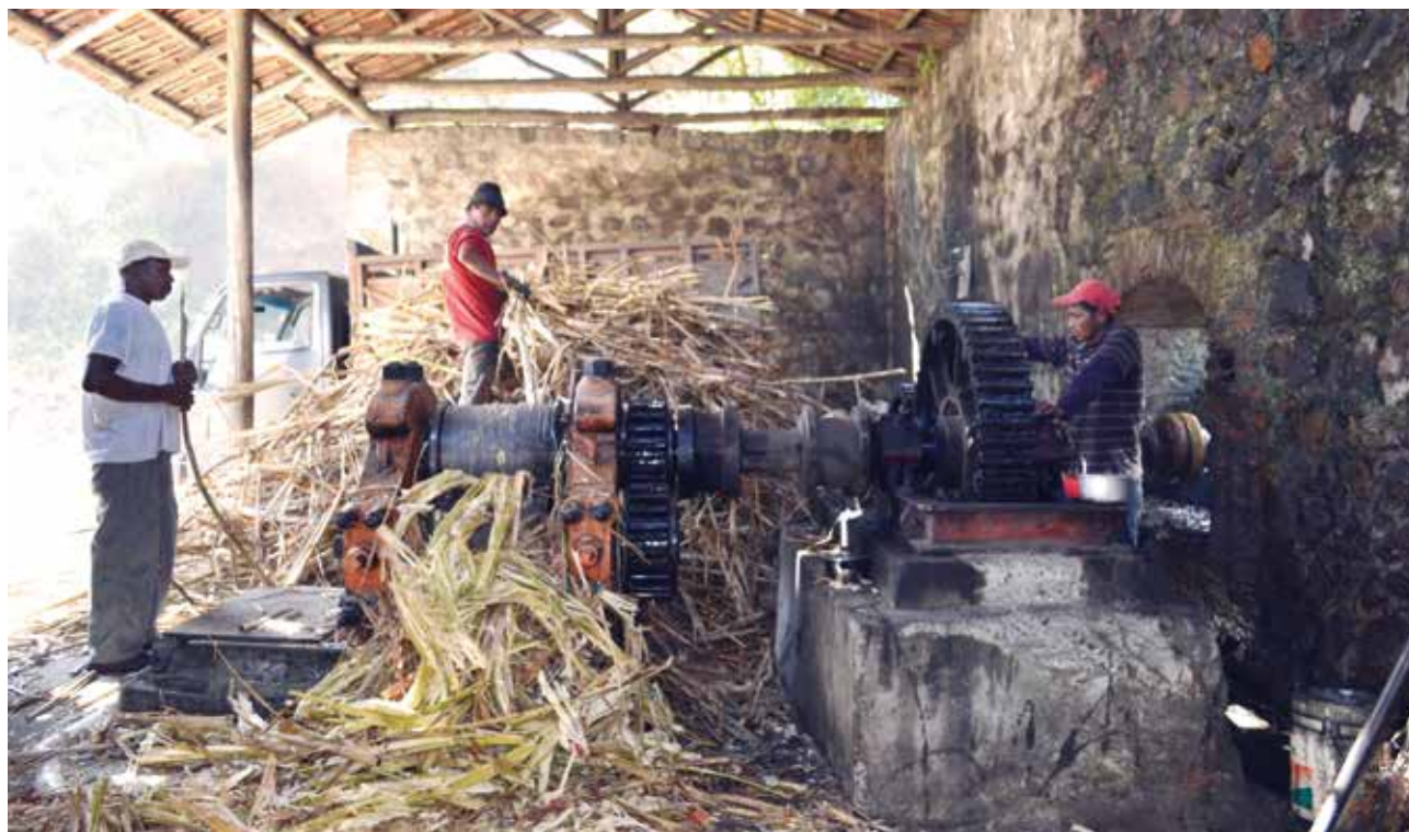
Trabajadores en el trapiche de Santa Ana que aún se mantiene en funcionamiento

en la hacienda con un pago mínimo o se decidían por ser obreros en la construcción del ferrocarril 33 . Ante esta realidad, elaboraron estrategias de sobrevivencia como el cambeo (intercambio o venta) de panela para obtener ingresos adicionales.