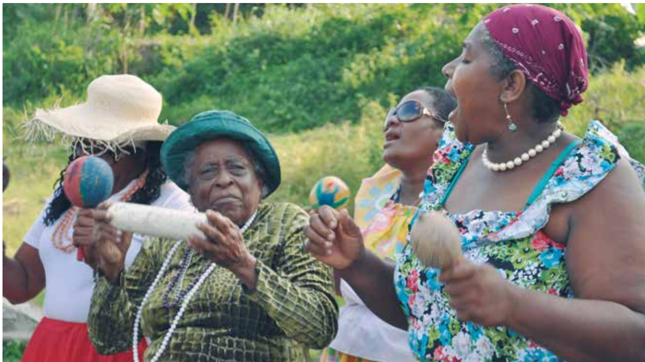
La sonoridad afroecuatoriana se acompaña con cununos, guasá y bombos, y expresa temas religiosos, de amor, de cortejo, y de relación con la naturaleza

aprendan que yo voy a morir. Les digo, “traigan para copiar alabados, arrullos” y ninguna se viene y entonces eso ya se queda perdido ahí.