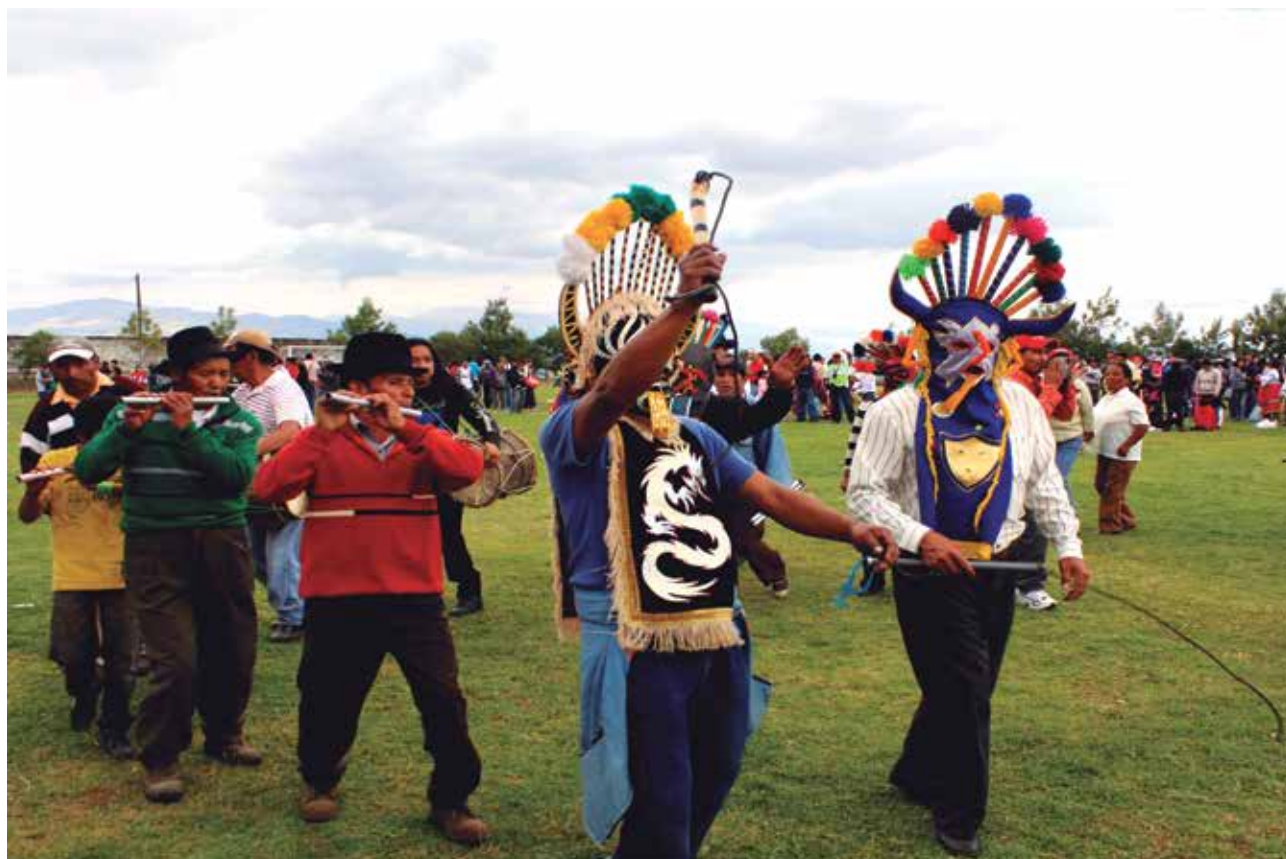
Grupo de diablumas y flautistas en el Desfile de la Confraternidad Malchingueña, 29 de junio de 2013

Ofrecía además comida y bebida elaborada por los mismos trabajadores de la hacienda. Este rito era similar al de las oyanzas , que se festejaban al concluir la construcción de una casa, al formalizar un contrato o al terminar las cosechas en las haciendas.