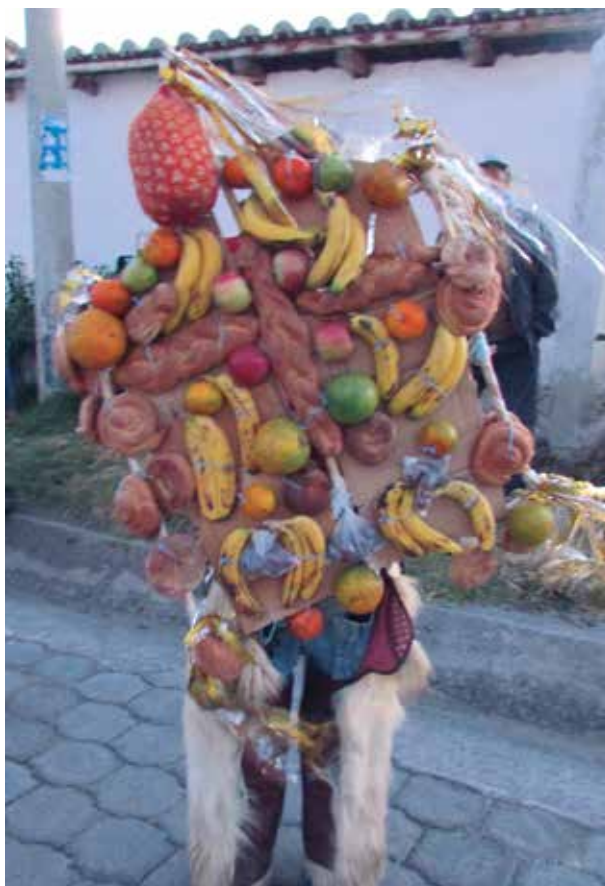
Castillo, entrega de rama en la comunidad Guallaro Grande, Tabacundo, 27 de julio de 2013

Las festividades, al tener una gran carga comunicativa, permiten que los conocimientos, los sabores, las técnicas y las prácticas ancestrales sean transmitidas en los momentos de ritualidad y de reencuentro con los espacios sagrados. Más allá de ser un acontecimiento exclusivamente festivo, San Pedro encierra historias, procesos de autonomía y de lucha frente al poder de la Iglesia y al poder estatal.