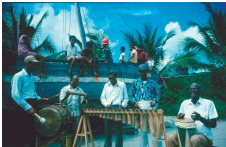
Músicos de marimba en Súa, 1976

La marimba es una expresión cultural presente en varios países de América Latina. En cada lugar la música de marimba adquiere diferentes significados según su historia y su uso social. En Ecuador, el pueblo afro esmeraldeño la reconoce como parte de su patrimonio cultural y frente a los cambios propios de las manifestaciones culturales inmateriales varias comunidades de Esmeraldas, en trabajo conjunto con los GADS y el INPC, se encuentran en proceso de elaboración del Plan de Salvaguardia de la música de marimba, danzas y cantos tradicionales, en el marco de la candidatura binacional presentada a la Unesco.