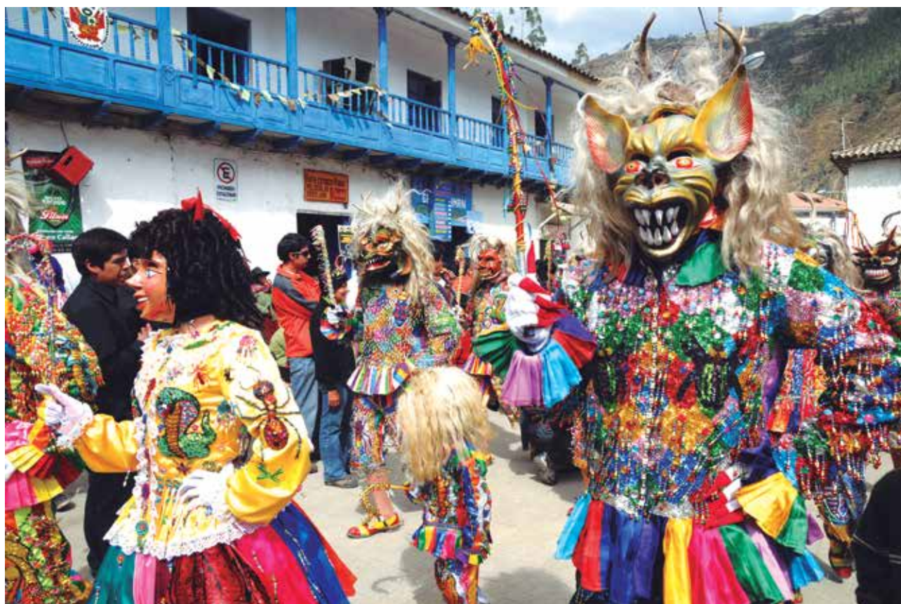
Danza de los saqras en la fiesta de la Virgen del Carmen de Paucartambo, Cusco - Perú

Esta metodología es asumida como un principio teórico de cooperación en turismo sostenible por instituciones públicas y multilaterales, como las que componen el sistema de Naciones Unidas (Unesco, OIT, OMT, PNUD, PNUMA y FIDA), plataformas empresariales y diversas ONG en América Latina. Dentro de estas propuestas, que vinculan turismo y desarrollo, también se ha posicionado el denominado turismo rural comunitario (TRC) como una dimensión de lucha contra la pobreza.