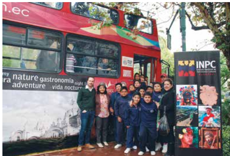
Recorrido patrimonial con estudiantes de escuelas fiscales de Cuenca

De esta manera la Institución reafirma su compromiso de ejecutar acciones dirigidas a la preservación y salvaguardia del patrimonio cultural nacional.