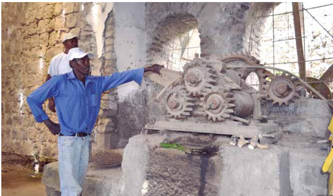
Antiguo trapiche en desuso, localizado en la hacienda La Loma

En el valle del Chota, el complejo incluía las haciendas Caldera, Changuayacu, Pusir y Carpuela; Tumbabiro y Santiago de Monjas –en el valle de Salinas–, Cuajara, La Concepción, Chamanal, Huaquer y Pisquer en La Concepción. Todas las haciendas mantenían la misma estructura jesuita, cuya organización social estuvo basada en una política de unidad familiar entre los esclavos 13 , posiblemente porque los jesuitas notaron la importancia que tenía la familia para los esclavos africanos. De todas formas, según Bouisson 14 , los religiosos se encargaron de comprar esclavos y esclavas en proporciones similares y se prohibieron las uniones con mestizos e indígenas. Los jesuitas evitaban ventas de esclavos que podrían desintegrar el núcleo familiar y, según Rosario Coronel, mantenían a los trabajadores bien alimentados y vestidos. Dado que los esclavos no pagaron diezmos hasta 1767 15 y mantenían