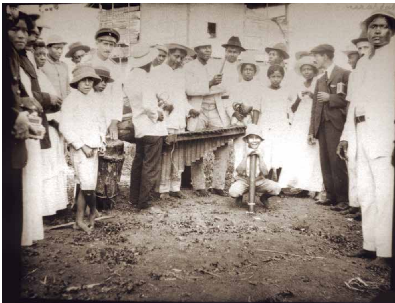
Celebración con marimba en Esmeraldas ca. 1890 Diapositiva en placa de cristal

El pueblo afro-esmeraldeño le ha dotado de sentidos simbólicos de continuidad, de persistencia y resistencia. Actualmente, su creación y recreación cultural se afirma sobre el instrumento, la música y la danza de marimba.